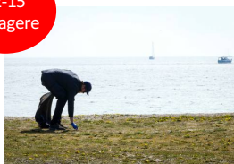
Faaborg Eat, sleep, pant, repeat